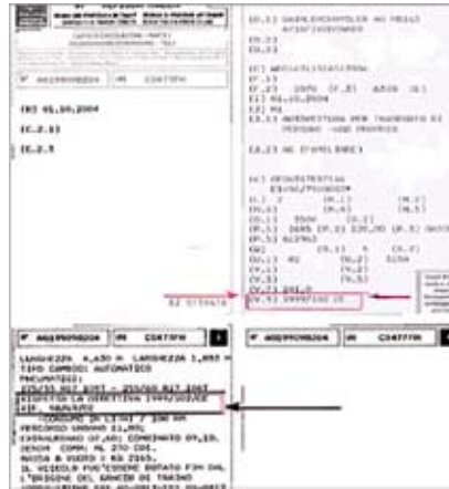
Figura B: carta circolazione nuovo formato A4